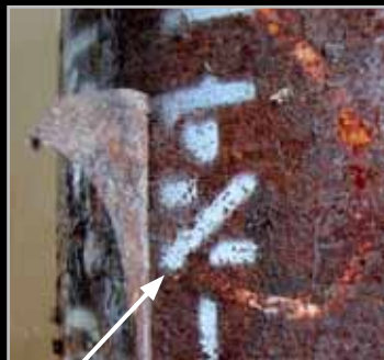
Tubería API 5L