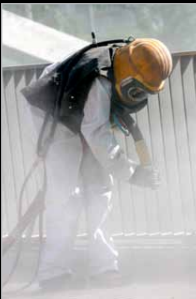
Chorreado Abrasivo tradicional

Elimina la necesidad de equipos para el chorreado abrasivo que son complejos y costosos.